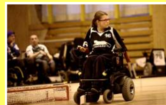
Foto z I. a II. ligového kola