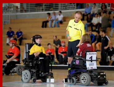
Turnaj 4 národů - září 2013