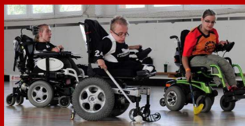
II. kolo - červen 2013