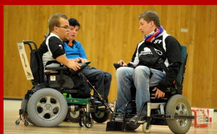
III. kolo - říjen 2013