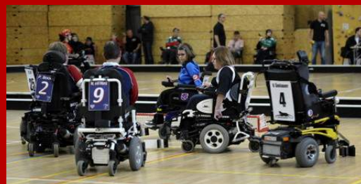
3. Prague Cup - květen 2013