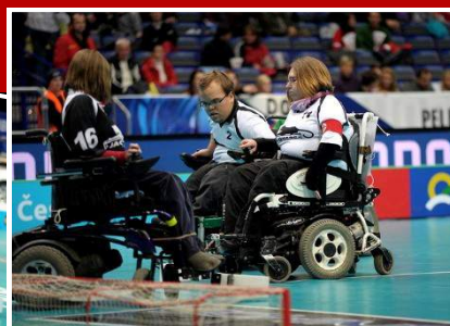
Foto z exhibice na MS žen ve florbalu 2013 - ČEZ Aréna