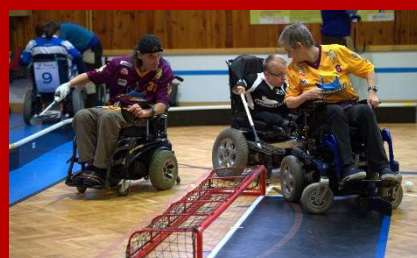
IV. kolo - listopad 2013