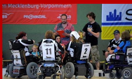
8. Euro-cup - červenec 2013