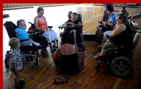
Soustředění - červenec 2013