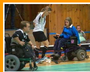
Foto z IV. kola 2013 Trutnov