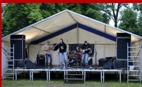
IV. Kárafest - červen 2013