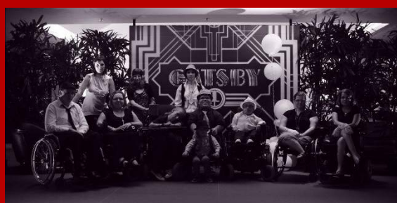
2. turnaj v Eindhovenu - srpen 2013