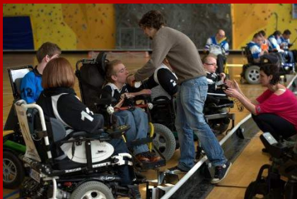
I. kolo - březen 2013