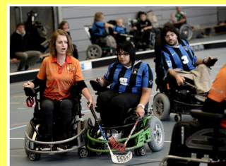
Foto z mezinárodních turnajů Euro-Cup a Zurich

„Líbilo se mi, jak všechno na vlastní pěst zorganizovali.“