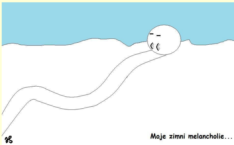
Moje zimní melancholie...

„Především vy, váš skvělý tým... a mám možnost poznat nové lidi, získat nové zkušenosti a zážitky.“