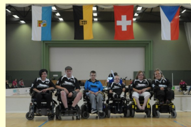
7. Euro-cup, Guestrów 2011

V české reprezentaci, která se zúčastnila již dvou Mistrovství Evropy, měl náš klub zastoupení vždy čtyř hráčů.