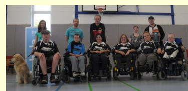
2. Champions Cup, Weinheim 2011

takže startovní vycházelo na cca 12 000,- Kč. Tak to máme dopravu, ubytování, jídlo (v tomto případě snídaně a jednu večeři) a zbývají náklady na zajištění asistence. Jezdí se na 4 dny včetně cesty a to v průměru se 6 hráči a 4 doprovody (trenér, řidiči, asistenti, technici). Jelikož se jedná o nejméně dva pracovní dny a náročnou akci, je vhodné těmto doprovodům nabídnout alespoň jistou kompenzaci. V našem případě se jedná o 1 500,- Kč až 2 000,- Kč za akci. Když spočítáme konečnou sumu, dostaneme se na cca 30 000,- Kč za ten nejbližší a né až tak drahý mezinárodní turnaj.