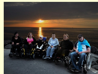
Výlet k moři, Warnemuende při turnaji 7. Euro-Cup

Všechny tyto události nám pomohly vybudovat silný tým, který od druhého ligového kola nezaznamenal ani jednu porážku a získal tak mistrovský titul. BBR