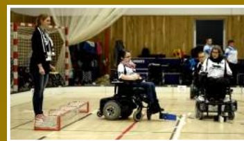
Foto z I. a II. ligového kola